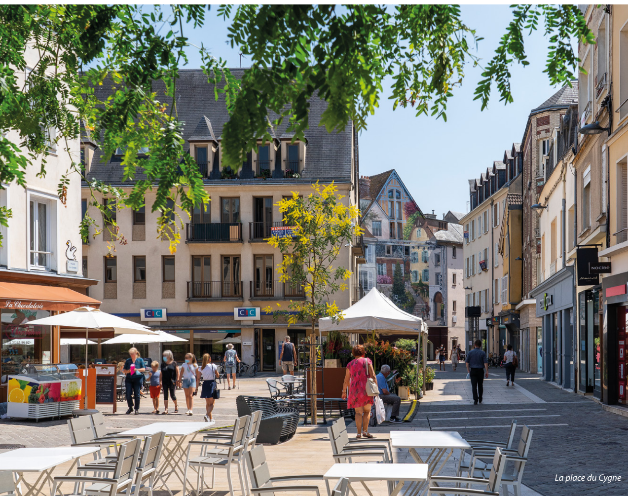
La place du Cygne

Les 120 hectares de parcs, de jardins ou de squares, les nombreuses pistes cyclables et les balades sur les rives de l'Eure, contribuent au charme de la ville.