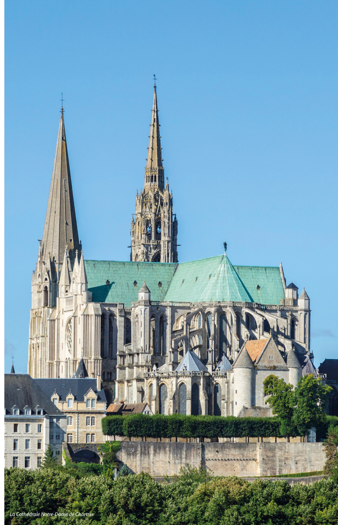
La Cathédrale Notre-Dame de Chartres